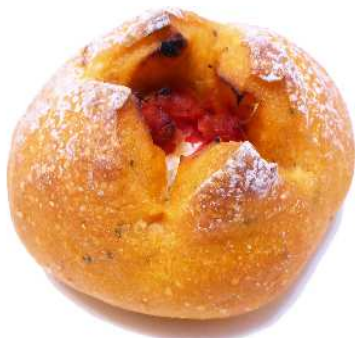
セミドライトマトとクリームチーズのパン

荷姿 : 500g × 6pc 用途 : パスタ、ピザ、デリカテッセン等 原産国 : オーストラリア 備考 : 保存料、添加物は使用していません