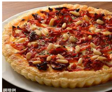
セミドライトマトと松の実のキッシュ