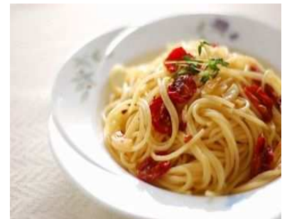
セミドライトマトのパペロンチーノ