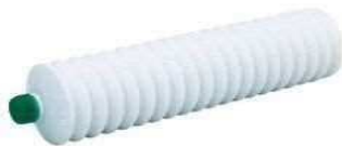
ベルハンマー カートリッジグリス 420ml