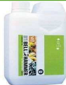
ベルハンマー 原液 1000ml